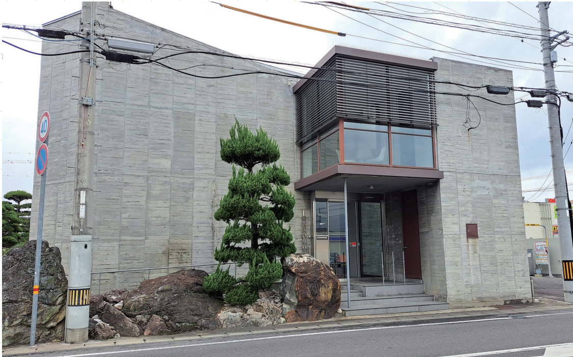
四国物産 本社外観

香川県観音寺市に本社を置く四国物産株式会社は、1918年(大正7年)の設立以来、石油製品並びにLPガスの販売、ガソリンスタンド運営などのエネルギー関連事業をはじめ、住宅や空調設備販売や省エネ住宅工事などの環境関連事業、食肉・加工食品製造などを行う食品関連事業の3つの事業を展開し、その安定した経営基盤により「快適生活提案企業」として地域の人々の快適な生活を支えている。