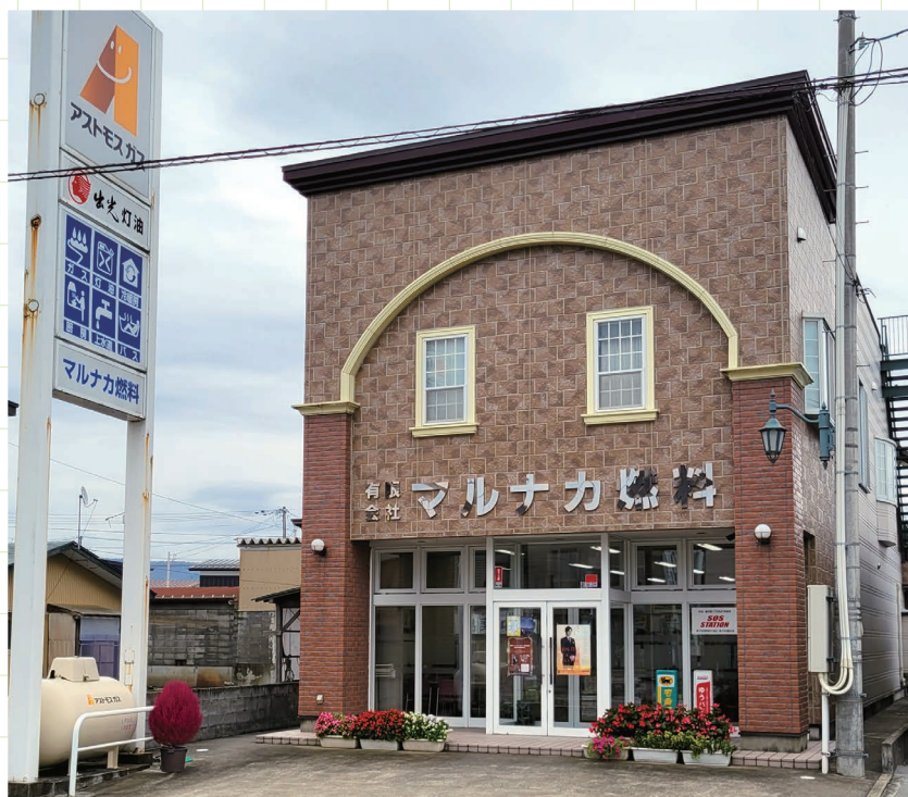
マルナカ燃料社屋

LPガス・灯油などの燃料および機器販売をはじめ、上下水道工事(市の指定業者)、住宅・空調機器販売(リフォーム)を展開するマルナカ燃料。横手市の合併前でいう旧十文字町のほか、湯沢市、大仙市などがガスの供給エリア。地域に密着した燃料の安定供給、保安体制はもとより、LPWA導入での効率化を図りながら、お客さまとの繋がりにも重きを置く。